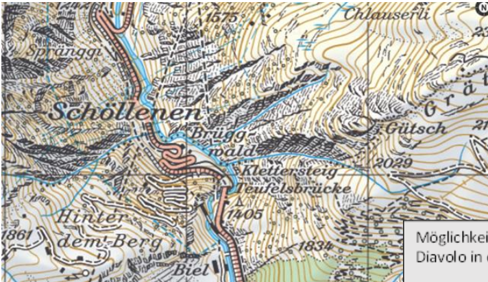
Möglichkeit 1: Diavolo in der Schöllenschlucht

Ich freue mich auf Deine Anmeldung, bis Bald Matthias Wyder