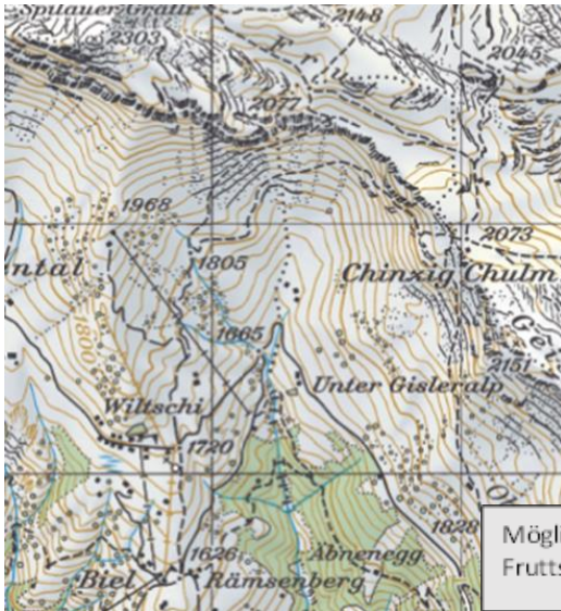
Möglichkeit 2: Fruttstäga vom Biel aus